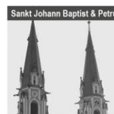
Sankt Johann Baptist & Petrus